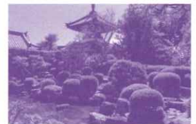
表紙／穴太寺 (亀岡市)