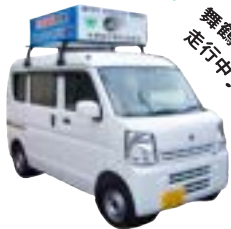
▲交通安全広報カー(全舞鶴)