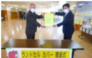
市立下京涉成小学校(下京)