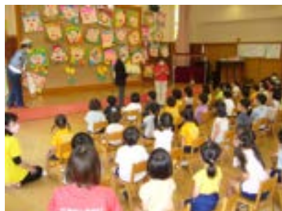
▲こりゅうら保育所での読み聞かせの様子(京丹後)

●年少さん向け紙芝居 「パンダのパンちゃん おててをぎゅうっ！」 ●年中さん向け紙芝居 「パンツがとんでったー！」 ●年長さん(小学校低学年)向け紙芝居 「あんぜんブラザーズの だいぼうけん」