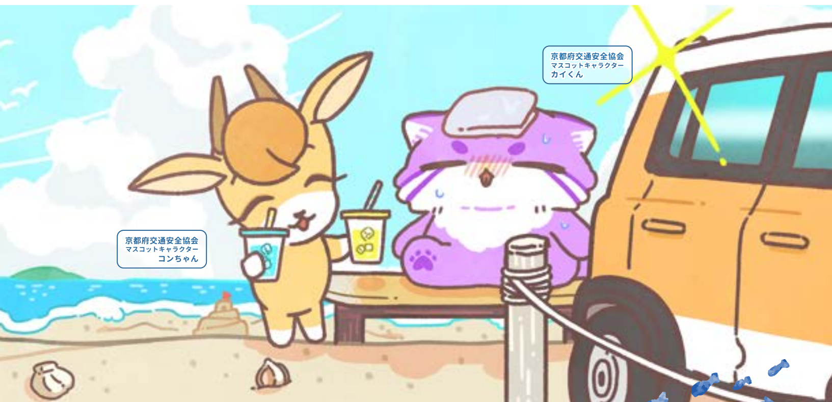
京都府交通安全協会 マスコットキャラクター コンちゃん