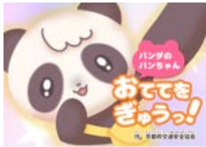
▲年少さん向け紙芝居