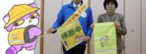
▲贈呈の様子 竹の里小学校(西京)