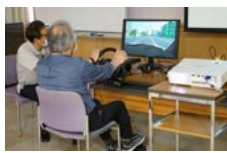
▲認知機能、身体機能チェックシミュレーション

6月2日、京丹後市と共に高齢者を対象とした『ライフドライバースポーツプロジェクト研修会』を開催しました。この研修会は、生活を営む上で自動車を手放せない高齢者の方々に現在の自分自身の認知機能や身体機能を知っていただき、安全な運転を継続していただくことを目的としています。