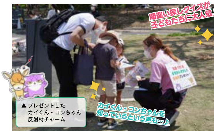
間違い探しクイズが子どもたちに大人気！