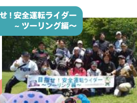
目指せ!安全運転ライダー - ツーリング編 -

今年の5月18日(土)には「目指せ!安全運転ライダー」ツーリング編や、毎月第3土曜日にはゼスト御池御幸町広場で、恒例の交通安全イベントを開催しました。