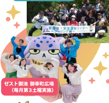
ゼスト御池 御幸町広場 (毎月第3土曜実施)

主催する交通安全イベントのほか、京都府内で開催されるイベントに参加して、幅広く交通安全を呼び掛けました。