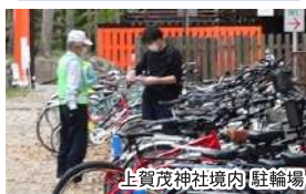
上賀茂神社境内(駐輪場)