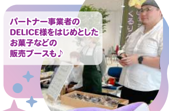
パートナー事業者のDELICE様をはじめとしたお菓子などの販売ブースも♪