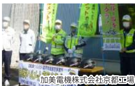
加美電機株式会社京都工場