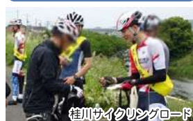
桂川サイクリングロード